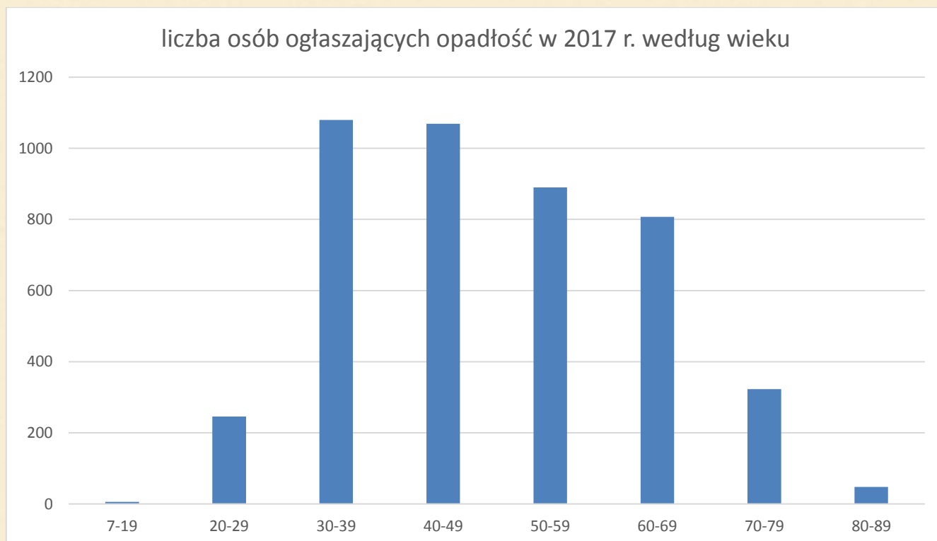
Struktura wieku osób ogłaszających upadłość w 2017 r.:

Jeżeli chodzi o wiek osób w stosunku, do których ogłoszono upadłość konsumencką w 2017 r. to najmłodsza osoba ma 7 lat, a najstarsza 89. Średnia wieku to 49 lat. Najwięcej upadłości dotyczy ludzi w wieku 30-39 lat 24,17%.